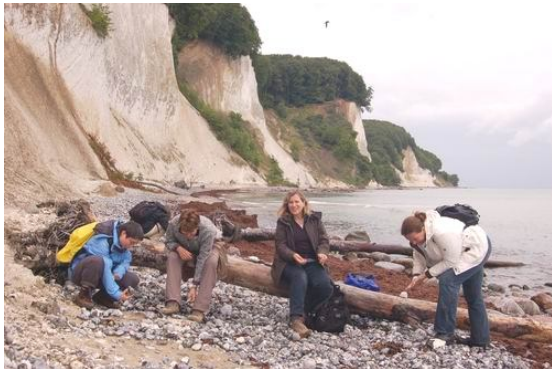
Fossiliensammeln an der Jasmunder Kreideküste

Rügen wirkt beim Blick auf die Landkarte wie ein Puzzle von Land und Wasser. Sanfte Hügelketten, ein Mosaik von Feldern und Wiesen, stille Buchenwälder, dunkle Waldseen, von majestätischen Bäumen gesäumte Alleen, verträumte Fischer- und Bauerndörfer sowie mondäne Badeorte der Jahrhundertwende bestimmen das Bild. Breite Sandstrände mit feinem weißem Ostseesand wechseln ab mit mächtigen Steilufeln wie den Kreidefelsen der Stubbenkammer.