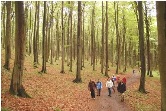
Steiluferrhöhenweg auf der Halbinsel Jasmund

Busfahrt auf die Halbinsel Jasmund zur Stubbenkammer, Besuch der großartigen naturkundlichen Ausstellung am Königsstuhl. Wanderung auf dem Steiluferrhöhenweg durch den Orchideen-Buchenwald bis zum Kieler Ufer, nach dem Abstieg geht es am Geröllstrand unterhalb der Kreidefelsen weiter bis nach Sassnitz, unterwegs werden Donnerkeile und andere Fossilien gesammelt. Im lebendigen Fischerhafen von Sassnitz locken Fischrestaurants zur Einkehr. (Wanderstrecke ca. 12 km)