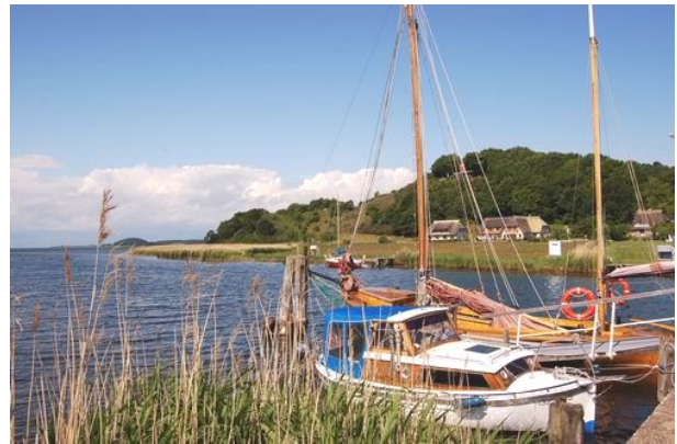
Die idyllische Boddenküste bei Moritzburg

Wir wohnen in einem familiär geführten Vier-Sterne-Hotel in Binz in der Nähe des Kleinbahnhofs. Der Ostsee-Strand und die Granitzwälder sind in wenigen Minuten zu Fuß erreichbar. Im Untergeschoss des Hotels dient ein großzügiger, schön gestalteter Bad-