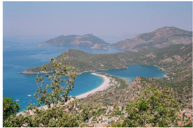
Blick vom Hang des Babadag auf die Küste von Ölü Deniz

Die touristisch kaum erschlossene Küste des gebirgigen Lykien bezaubert nicht nur mit großem landschaftlichen Reiz. Sie hat auch hochkarätige antike Stätten zu bieten, denen die Lykier ihren ganz eigenen Charakter gaben. In den Fels eingeschnittene Grabfassaden und prunkvolle Sarkophage geben bis heute Rätsel auf. Zum Streifzug eingeladen sind diejenigen, die gerne