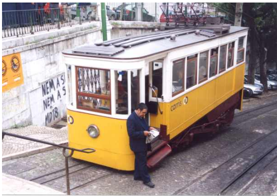
Seilzugbahn an einer steilen Strasse

Lissabon, am Schnittpunkt der maurischen und europäischen Kultur gelegen, ist eine der facettenreichsten Städte der Welt. Das warme südliche Licht lässt die prächtigen Kirchen und prunkvollen Adelshäuser in majestätischem Glanz erstrahlen.