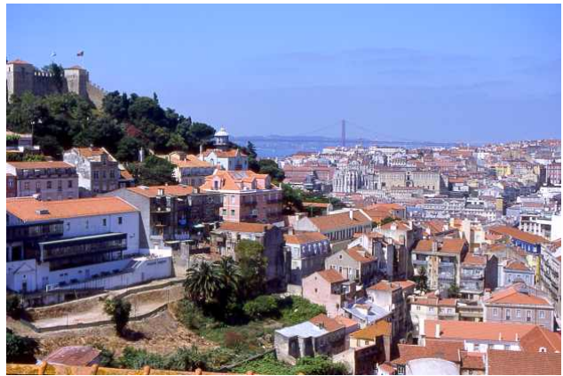
Blick über Lissabon mit Burghügel und Tejo-Brücke

Lissabon, am Schnittpunkt der maurischen und europäischen Kultur gelegen, ist eine der facettenreichsten Städte der Welt. Das warme südliche Licht lässt die prächtigen Kirchen und prunkvollen Adelshäuser in majestätischem Glanz erstrahlen.