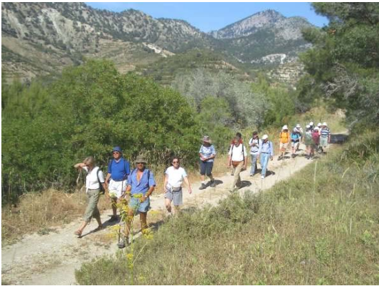
Wanderung im Besparmak-Gebirge

Zypern ist als sonnenverwöhnte Urlaubsinsel im östlichen Mittelmeer bekannt. Der Nordteil der Insel ist aufgrund der politischen Lage der letzten 30 Jahre jedoch vom Massentourismus mit all seinen negativen Folgen verschont geblieben. Der EU-Beitritt Zyperns und die Annäherung des türkisch-sprachigen Nordteils und des griechisch-sprachigen Südtails haben bislang noch nicht zur endgültigen politischen Lösung, jedoch