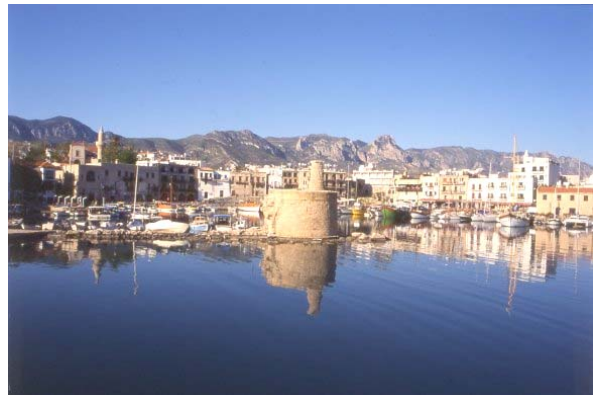
Blick auf Girne und das Besparmak-Gebirge

Unser Stadthotel in Girne mit Swimmingpool liegt in fußläufiger Entfernung (1000 m) zum quirligen Zentrum