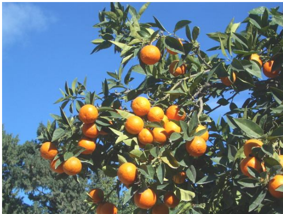
Besuch in einer Orangenplantage im Westen

Die strategisch günstige Lage im östlichen Mittelmeerraum machte Zypern zu allen Zeiten zu einem begehrten Stützpunkt der jeweils herrschenden Mächte. Von der Frühgeschichte über die byzantinische Zeit, der Zeit der fränkischen Lusignans bis hin zu den Venezianern,