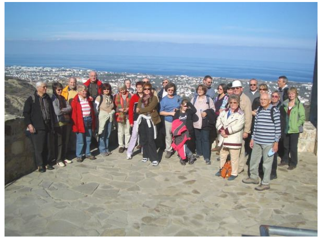
Die Silvester-Gruppe 2009 in Bellapais

Der langjährige Klimavergleich von Zypern und Frankfurt/Main lässt auf recht schönes Wetter in Nordzypern zum Jahreswechsel hoffen.