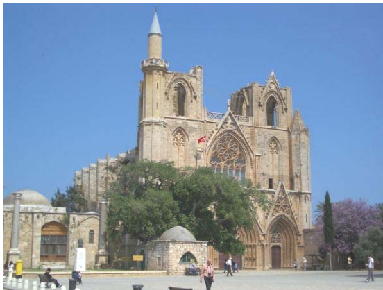
Frühere Krönungskirche der Lusignans in Famagusta

Schon in der Antike war Zypern durch seine zentrale Lage im östlichen Mittelmeerraum ein Knotenpunkt der wichtigen Handelsrouten. Griechen, Römer, Byzantiner, fränkische Lusignan-Könige, Venezianer, Osmanen, Engländer wechselten sich als Machthaber ab und hinterließen auf der Insel ihre Bauwerke. Nach Beendigung der engli-