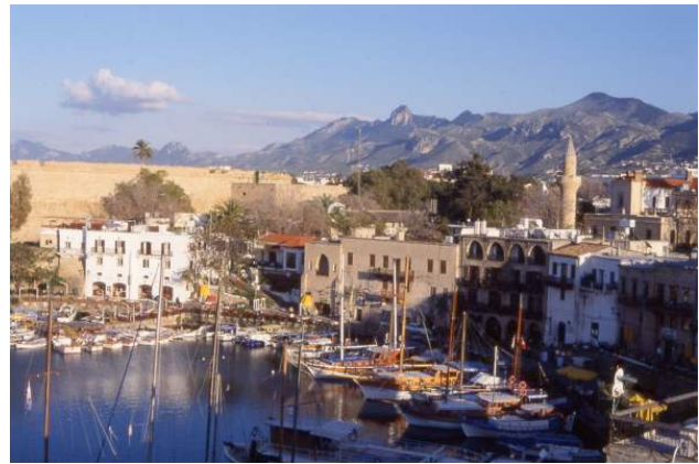
Blick über den Hafen von Girne und das Besparmak-Gebirge

Entlang der Nordküste erstreckt sich der teilweise mit Zypressen und Kiefern bewaldete, schroffe Bergkamm des Besparmak-Gebirges. Am Fuß des Gebirges liegt die Hafenstadt Girne (griechisch Kyreneia) mit typisch mediterranem Flair und vielen Einkaufsmöglichkeiten rund um den historischen Bilderbuchhafen. Nach Osten läuft