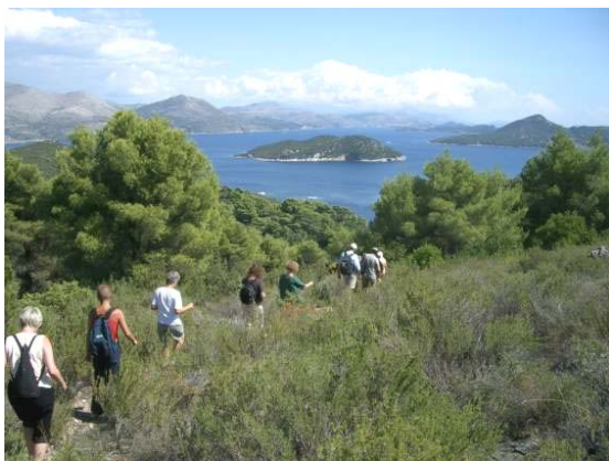
Wanderung auf Sipan mit herrlichen Panoramablick

Süddalmatien bezaubert durch unberührte Natur, wildromantische, mit duftenden Kräutern bewachsene Inseln, kleine Berg- und Fischerdörfer mit