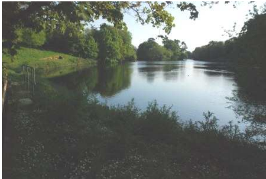
Durch das Waterworks Valley in der Inselmitte

Als größte der Kanalinseln bietet Jersey auch die größte Vielfalt: Der Norden hat hohe, spektakuläre raue Klippen zu bieten, der mildere Süden oft dicht bewachsene Steilküsten, dazwischen kleine und große Buchten mit goldenen Sandstränden und herrschaftlichen Anwesen. Entlang der Küsten wandern wir auf gut begehbaren, oft einsamen Pfaden.