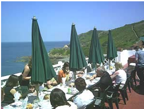
Blick von der Hotelterrasse auf die Steilküste

„Stücke von Frankreich, die ins Meer fielen und von den Engländern aufgelesen wurden“ Victor Hugo. Hier verbinden sich französische Lebensart und britischer Stil zu einer einzigartigen Mischung. Das milde, vom Golfstrom verwöhnte Klima sorgt für eine äußerst üppige, artenreiche Flora, die wunderschön in den alten englischen Gärten zur Geltung kommt. Wir wandern entlang