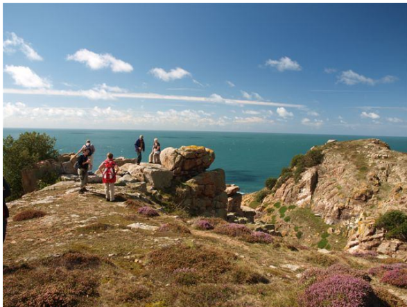
Wanderung an der einsamen Steilküste

Als größte der Kanalinseln bietet Jersey auch die größte Vielfalt: Der Norden hat hohe, spektakuläre raue Klippen zu bieten, der mildere Süden oft dicht bewachsene Steilküsten, dazwischen kleine und große Buchten mit goldenen Sandstränden und herrschaftlichen Anwesen. Entlang der Küsten wandern wir auf gut begehbaren, oft einsamen Pfaden.