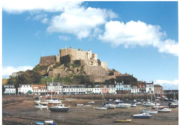
Mont Orgueil Castle in Gorey im Osten von Jersey

Unsere Unterkunft liegt oberhalb der Inselhauptstadt St Helier in ruhiger Lage und mit schönem Blick über St. Aubin's Bay. Bis zum Strand und ins quirlige Zentrum des Ortes mit Fußgängerzone, viktorianischer Markthalle und interessanten Museen sind es zu Fuß 20 bis 30 Minuten. 5x am Tag gibt es einen kostenfreien Shuttle ins Zentrum, eine Bushaltestelle ist wenige Gehminuten entfernt. Das 3-Sterne-Hotel ist ein denkmalgeschütztes Haus der Jahrhundertwende mit einem schönen Garten für die Gäste. Alle Zimmer sind mit