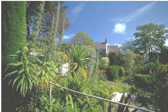
Das milde Klima lässt Pflanzen aus aller Welt gedeihen

Die kleinen britischen Kanalinseln, nahe der Normandie im Atlantik gelegen, empfangen den Besucher mit einer freundlichen, entspannten Atmosphäre, eindrucksvoller Landschaft und viel unberührter Natur. Sanddünen, zerklüftete Steilküsten und Buchten, Fischerdörfer, Landidylle, Kastelle, Wehrtürme und nicht zuletzt die lebhaften Städte sorgen für abwechslungsreiche Eindrücke. Hier finden Sie eine interessante Mischung aus