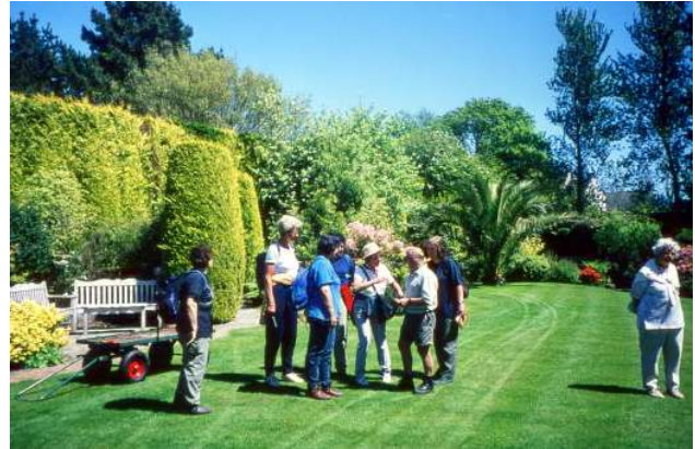
Führung durch einen privaten Garten auf Guernsey

Die Reisen sind sehr „privat“ geplant und stützen sich zum Teil auf die Verabredungen mit Gartenbesitzern, die uns die Zutritte meist aus Gefälligkeit gegenüber den Reiseleitern gewähren. Es kann sich aus persönlichen Gründen kurzfristig immer etwas ändern, even-