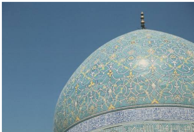
Kuppel der Imam-Moschee in Isfahan

Und neben all diesen (er)baulichen Dingen genießen wir bei Tee und Wasserpfeife die Ruhe und Muße in persischen Teehäusern, bummeln durch gewölbgedeckte, bunte Bazare und tau-