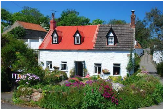
Bunte Dorfidylle auf Guernsey

Als „Stücke von Frankreich, die ins Meer fielen und von den Engländern aufgelesen wurden“ bezeichnete Victor Hugo die Kanalinseln. Hier mischen sich französische Lebensart und britischer Stil zu einer einzigartigen Mischung. Das milde, vom Golfstrom verwöhnte Klima sorgt auf den Kanalinseln für eine äußerst üppige, artenreiche Flora, die wunderschön in den alten englischen Gärten zur Geltung kommt.