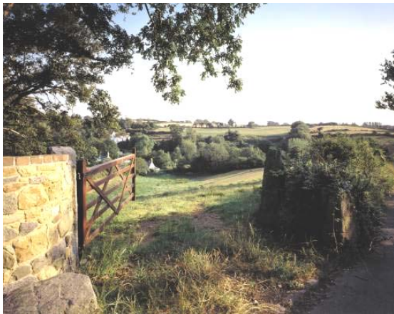
Die typische hügelige Landschaft von Guernsey

„Stücke von Frankreich, die ins Meer fielen und von den Engländern aufgelesen wurden“ – Victor Hugo. Hier mischen sich französische Lebensart und britischer Stil zu einer einzigartigen Mischung. Das milde, vom Golfstrom verwöhnte Klima sorgt auf den Kanalinseln für