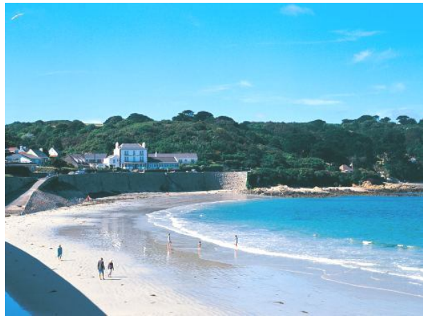
Blick über den Sandstrand der Rocquaine Bay zum Hotel

Als „Stücke von Frankreich, die ins Meer fielen und von den Engländern aufgelesen wurden“ bezeichnete Victor Hugo die Kanalinseln. Hier mischen sich französische Lebensart und britischer Stil zu einer einzigartigen Mischung. Das milde, vom Golfstrom verwöhnte Klima