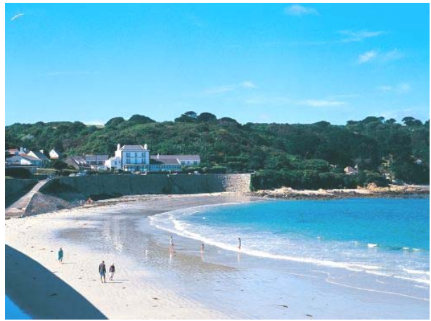
Blick über den Sandstrand der Rocquaine Bay zum Hotel

„Stücke von Frankreich, die ins Meer fielen und von den Engländern aufgelesen wurden“ – Victor Hugo. Hier mischen sich französische Lebensart und britischer Stil zu einer einzigartigen Mischung. Das milde, vom Golfstrom verwöhnte Klima sorgt auf den Kanalinseln für