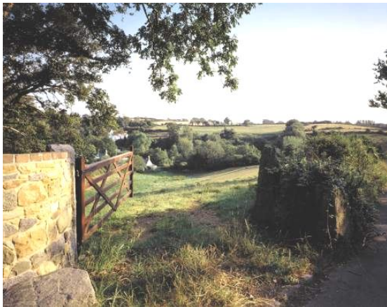
Die typische hügelige Landschaft von Guernsey

Als „Stücke von Frankreich, die ins Meer fielen und von den Engländern aufgelesen wurden“ bezeichnete Victor Hugo die Kanalinseln. Hier mischen sich französische Lebensart und britischer Stil zu einer einzigartigen Mischung. Das milde, vom Golfstrom verwöhnte Klima