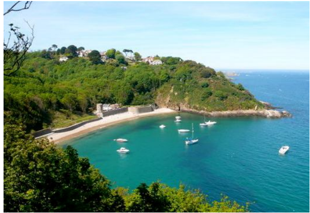
Blick auf die Fermain Bay im Südosten von Guernsey

Als „Stücke von Frankreich, die ins Meer fielen und von den Engländern aufgelesen wurden“ bezeichnete Victor Hugo die Kanalinseln. Hier mischen sich französische Lebensart und britischer Stil zu einer einzigartigen Mischung. Das milde, vom Golfstrom verwöhnte Klima sorgt auf den Kanalinseln für eine äußerst üppige, artenreiche Flora, die wunderschön in den alten englischen Gärten zur Geltung kommt.