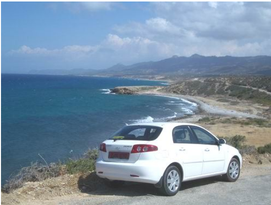
An der Nordküste westlich von Girne

Unsere 15-tägige Mietwagen-Rundreise kombiniert die einmaligen Sehenswürdigkeiten Nordzypemns mit Abstechern in Orte und Landschaften fernab des Tourismus. Auf eigene Faust können Sie sich so selbst ein Bild dieses faszinierenden Inselteils machen. Zu bedeutenden Bauten aus 25 Jahrhunderten kommen lange Sandstrände im