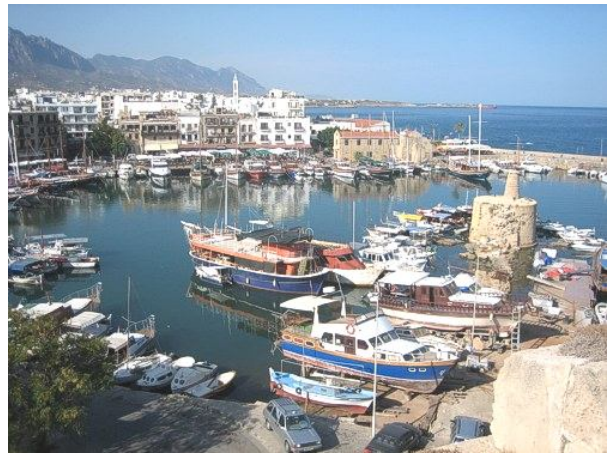
Blick über den malerischen Hafen von Girne

Ambelia Village / Region Girne: 6 Nächte Am oberen Ortsrand des beliebten und interessanten Dorfes Bellapais in terrassierter Hanglage angelegt, bietet die schön eingegründete Häusergruppe ein angenehmes Urlaubsdomizil. Von der Unterkunft und dem Swimmingpool aus hat man einen fantastischen Blick über den Ort, die Küstenebene und das Meer.